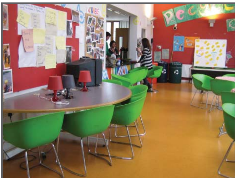
Cafeen i Sphere 17