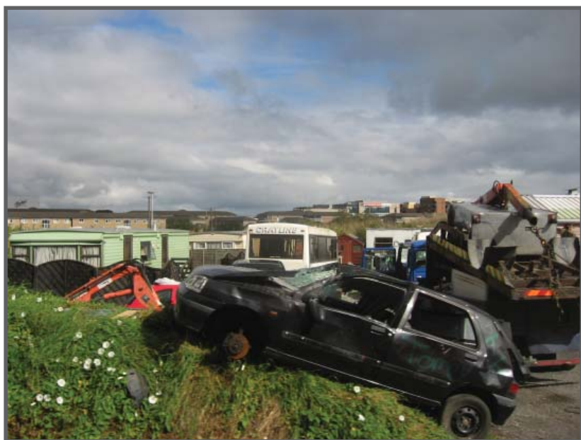
Darndale er også hjemsted for en stor del af Dublins romaer.

Lejlighederne er ikke indrettet kønt - kunne vi konstatere ved selvsyn. Små rum og mærkelige materialer og farver. Irish style, må det vel være. Lejerne findes oftest via en navneliste via Dublins bystyre - og er som oftest fra området i forvejen.